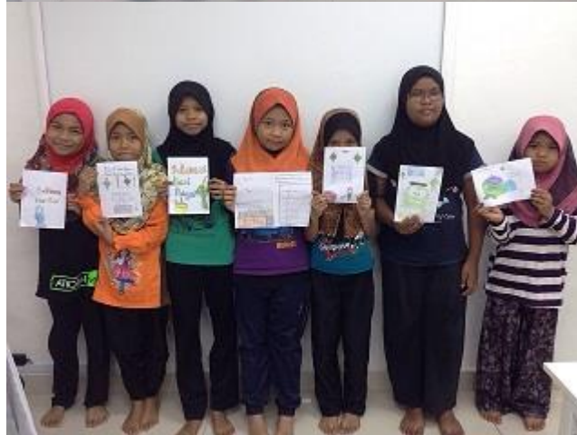
Caption : pertandingan mewarna